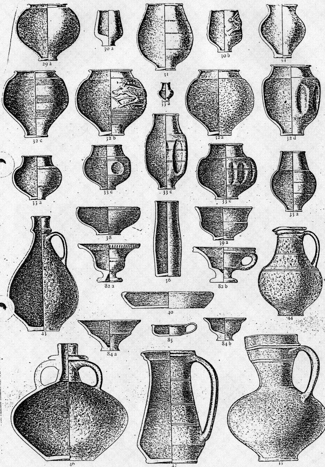
„Gefirnißtes“ Geschirr (Typus 29 - 40). Marmoriertes Geschirr (Typus 42 - 46). Glattwandiges Geschirr (Typus 82 - 85).