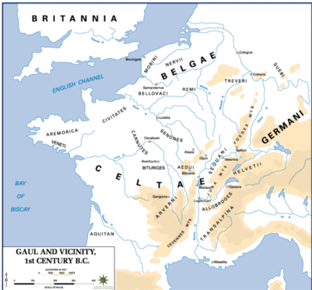
Keltisch gebied en omgeving rond de 1e eeuw v.Chr.