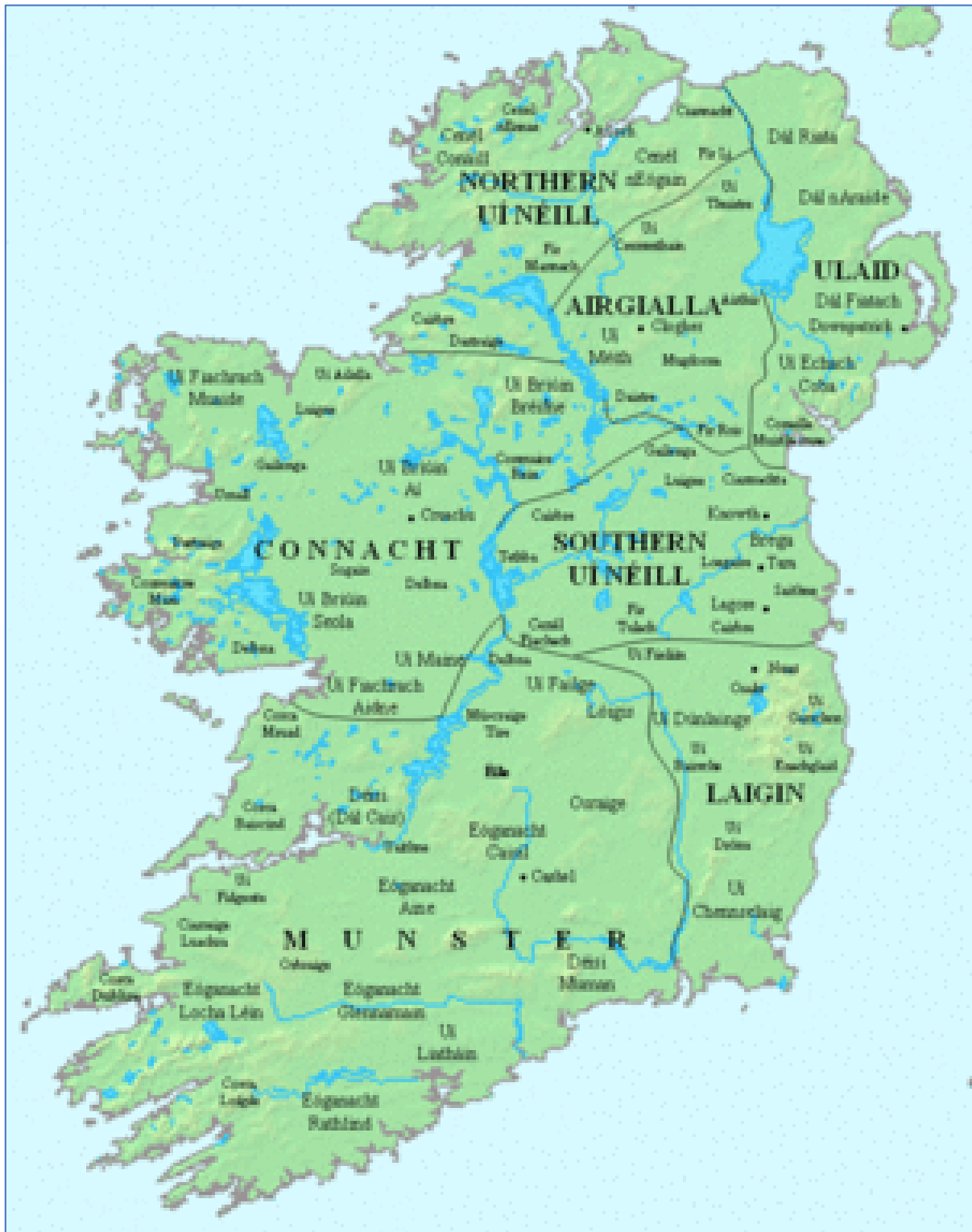
Vroegere volken en koninkrijken van Ierland, ca. 800