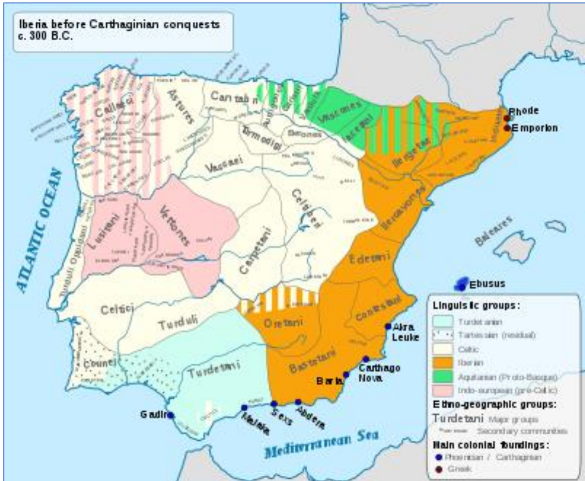
Belangrijkste taalgebieden in Iberia circa 300 v.Chr.

van de Hallstattcultuur en de latere waren die van volken met La Tène invloed. De tweede golf van Indo-Europese migratie ( Kelten van de Hallstatt-cultuur ?) in Portugees gebied had plaats in de 7e eeuw v.Chr. Keltische of Indo-Europese Pre-Keltische culturen en volken waren er in groten getale en Iberia kende een van de hoogste graden van Keltische vestiging van heel Europa.