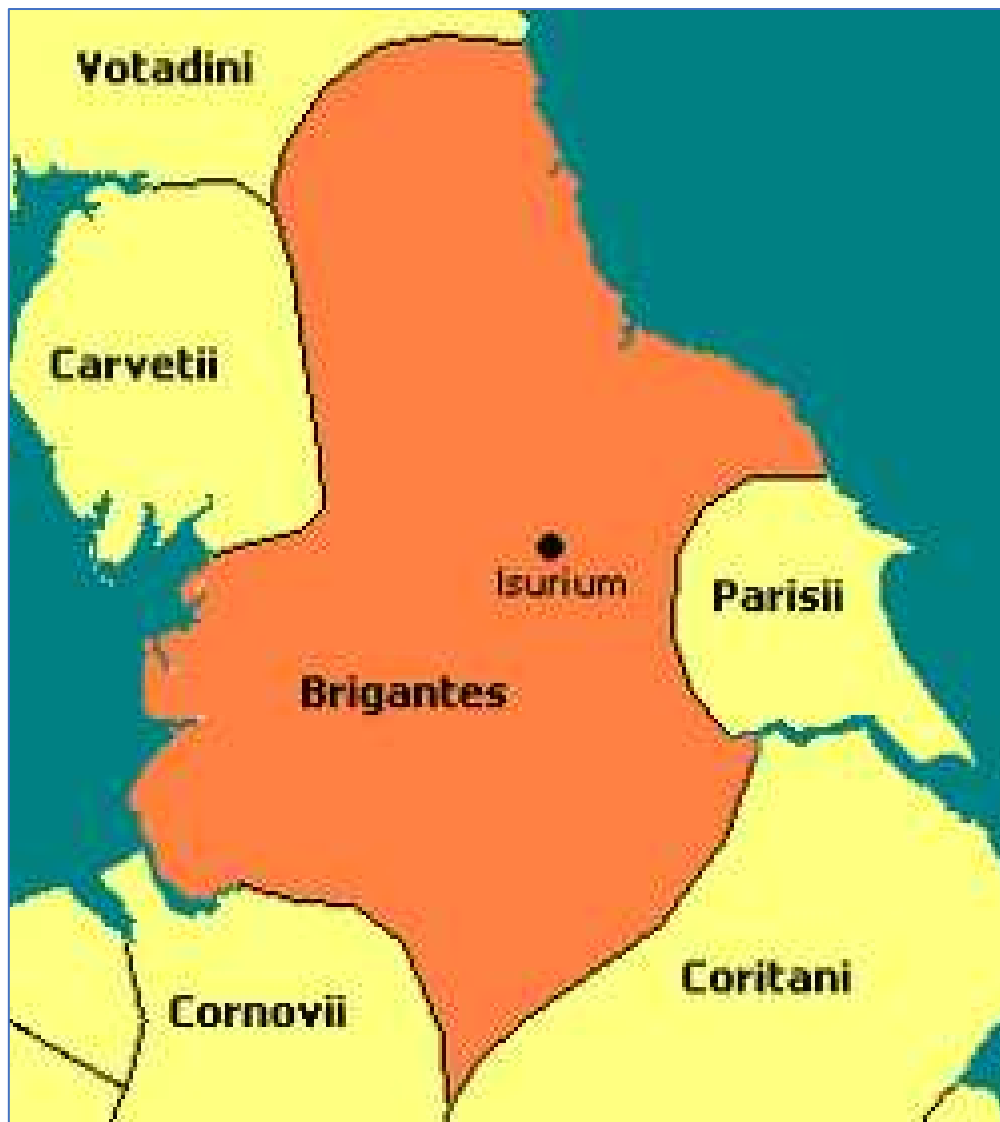
Het gebied van de Brigantes