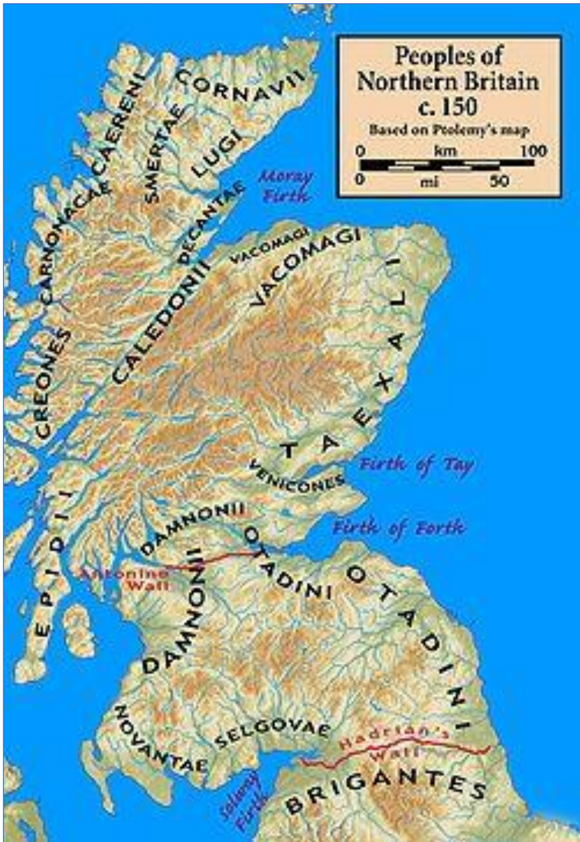
Noord-Britannia rond 150 AD

De Keltische bewoners van pre-Romeins en Romeins Britannia worden gezamenlijk aangeduid als Britten .