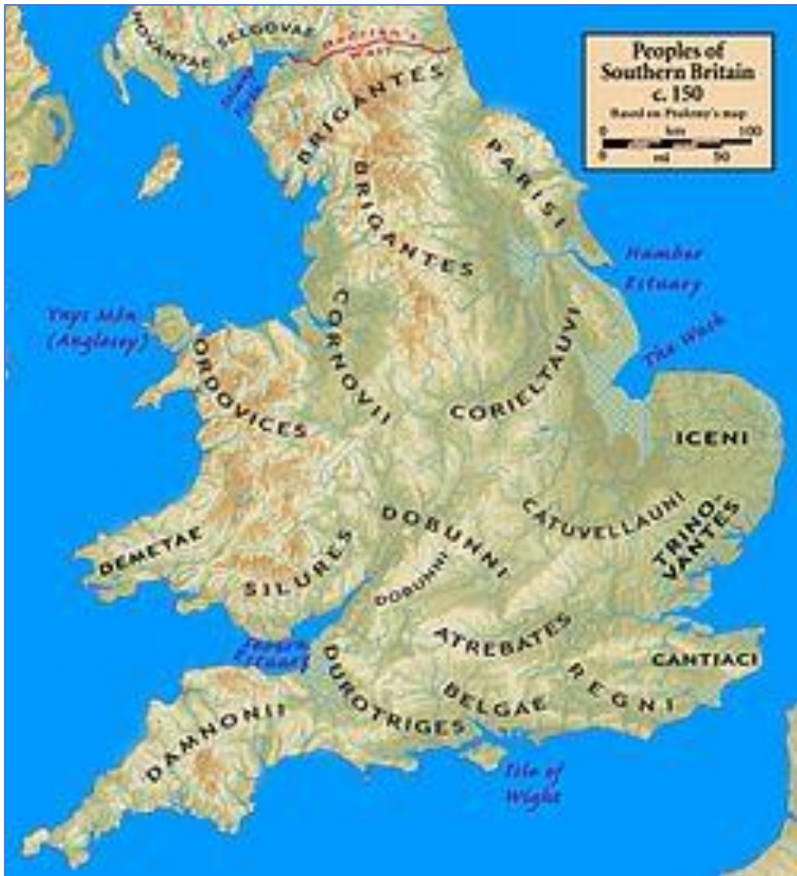
Zuid-Britannia rond 150 AD