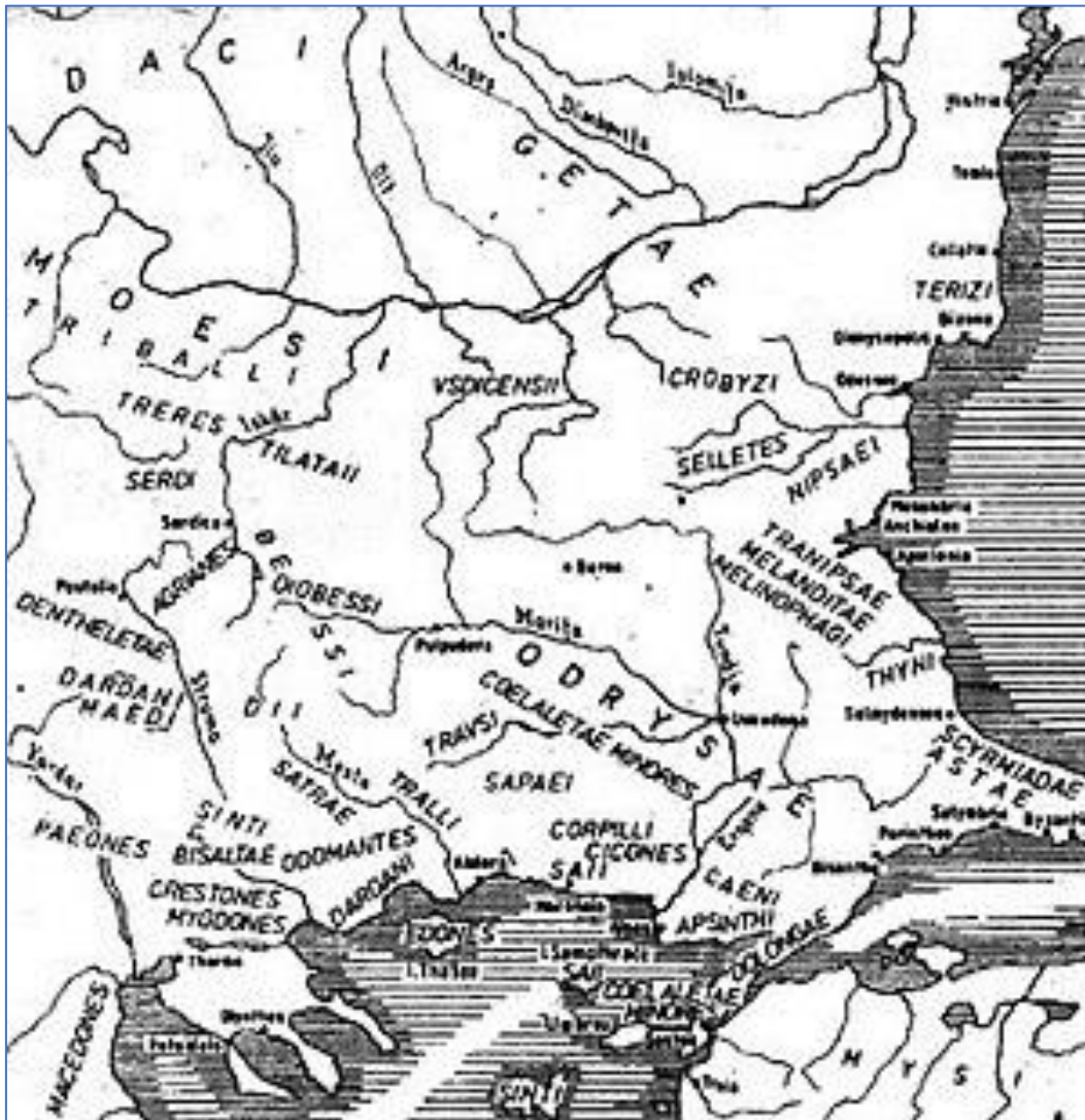
Keltische stammen in Thracië voor de komst van de Romeinen.