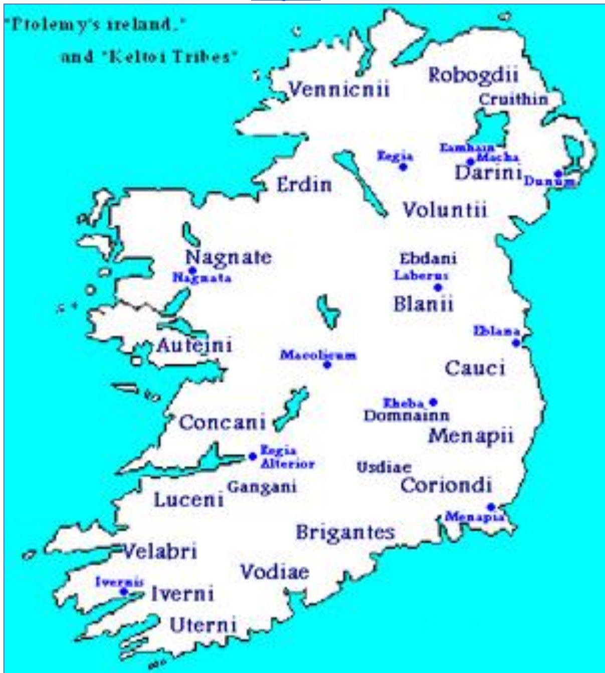
Keltische stammen in Irland aldus Ptolemeus